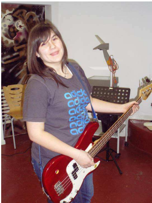
« NO SENSE » fait du punk-rock.